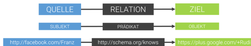
Abbildung 1: RDF Triples

Somit wird aus einem einfachen, alltäglichen Konzept des aktuellen Webs die Grundlage für eine maschinenlesbare Sprache und damit für die zuvor in Abschnitt 2.1 erwähnte semantische Annotation.